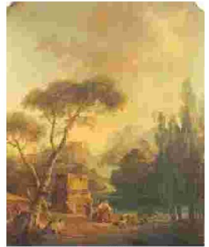
Les Bergers d'Arcadie