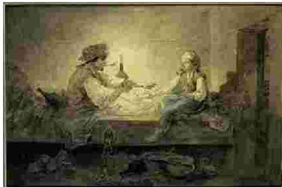
Intérieur de Ste Pélagie

Après Thermidor, Hubert Robert a pu regagner son domicile. Il était fort en colère, il avait perdu beaucoup de ses amis, et pensait que ceux qui avaient fait Thermidor étaient aussi assassins que ceux qui avaient péri. Il fallait donc être prudent. En rentrant chez lui il avait inscrit au dessus de sa porte d'entrée : « carcere tandem aperto » autrement dit : « la prison enfin ouverte ». C'était bien entendu pour lui-même mais nous verrons quelques lignes plus loin d'autres motifs. Dès sa sortie il commence à peindre son cycle des prisons qui peut nous conduire vers une seconde interprétation. Ste Pélagie et St Lazare relèvent de sa propre expérience mais la cellule du baron de Bésenal au Châtelet est une création. Robert n'était jamais allé au Châtelet.